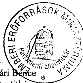
Rétvári Benke államtitkár