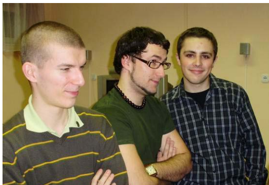
Barátok közt... ☺

Everything that has beginning, has end! (Minden, aminek kezdete van, vége is van!)