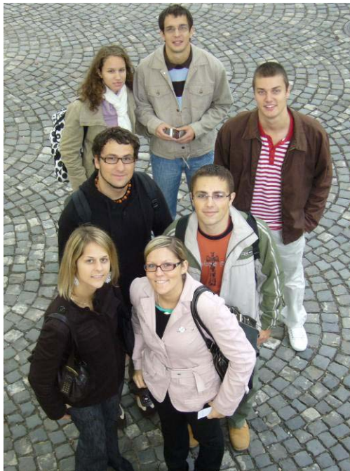
Szakkollégiumi kirándulás Pannonhalmán (2008)

„Vagy talállok utat, vagy török.” / latin közmondás /